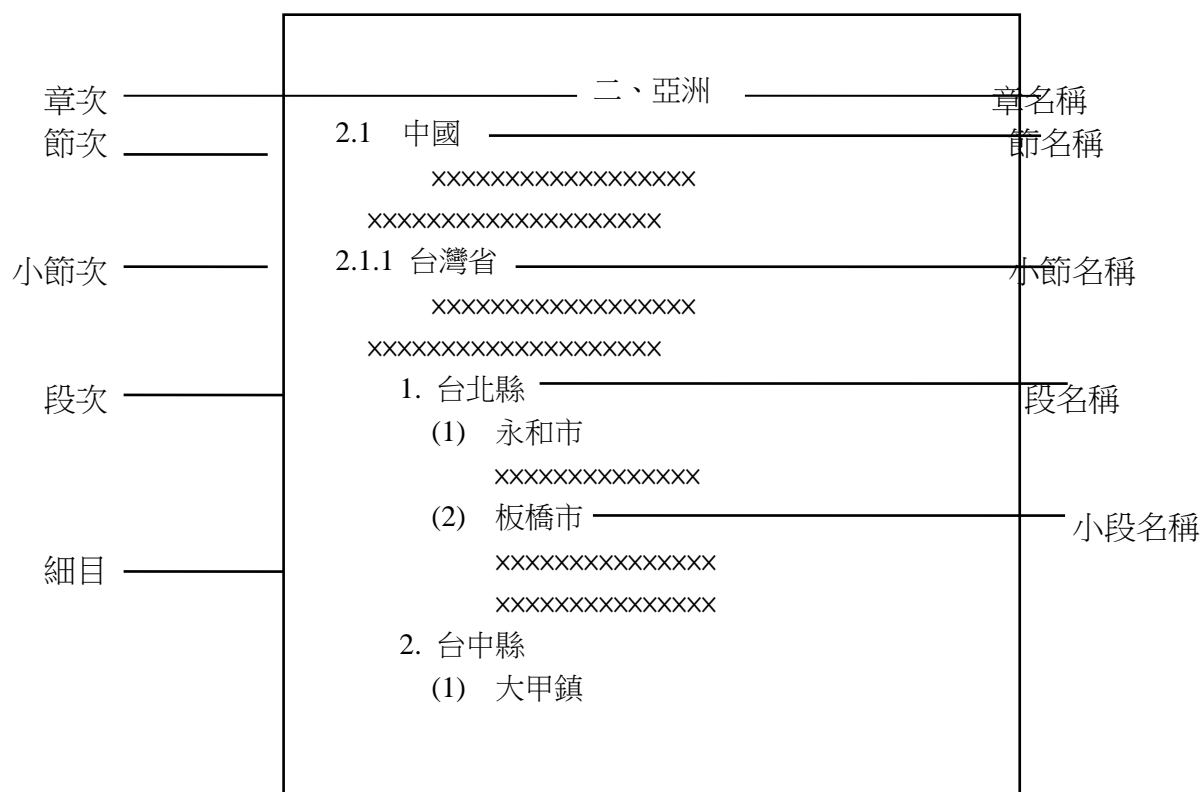
圖 4 章節、段落、文字層次範例