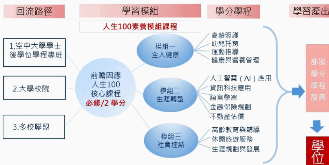
圖 2 第三人生大學回流教育路徑圖

試辦學校根據「前瞻因應人生 100」核心課程理念為規劃專長領域先備的知識基礎，並依各校特色與辦理目標，參照第三人生大學回流教育路徑（如圖 2），設計能呼應大學專業與地區特色之專長領域課程。試辦學校若以學系原本的专业學分為此一領域課程規劃的基礎，宜針對門檻較高的專業科目，放寬必修條件或畢業門檻，或重新組合整併原有之課程，以有助於終身學習與回流教育的友善措施為考量。為因應本計畫學系重新組合設計之專長領域課程，各校得整體評估系所既有修課規範、學分設計與抵免機制，以滿足學生的學習需求。