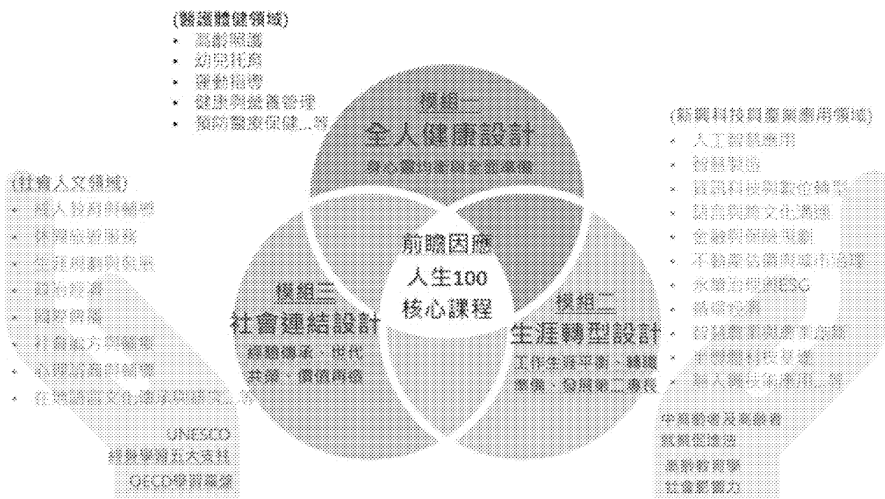
30+終身學習大學課程架構概念圖